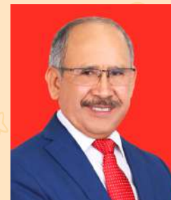
Presidente de ANIQUEM

Agradecemos a las entidades comprometidas con nuestros pacientes sobrevivientes de quemaduras, dado que su valioso apoyo no solo contribuye en la rehabilitación integral, sino que también les da una mejor calidad de vida.